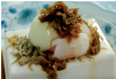
ボリューム満点冷奴! お酢を使ったかけダレが絶品!!