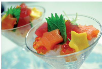
星いっぱいのカワイイお寿司♪ お子さんも大喜び♪