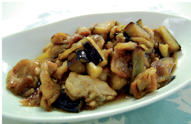
炒め物もお酢を使うとさっぱりいただけます。相性のいい豚肉となすを是非お楽しみください!