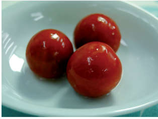
ミニトマトの酸味と甘さがさらに際立ちます。さっぱりおいしく元気になれるトマトの酢漬け♪